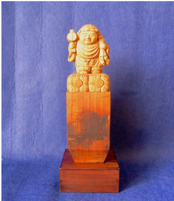
大栓(だいせん)という部材に彫られた大黒天