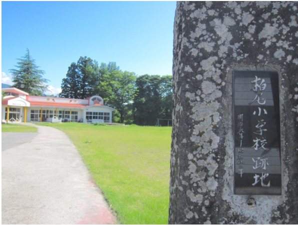
旧柏尾小学校跡地